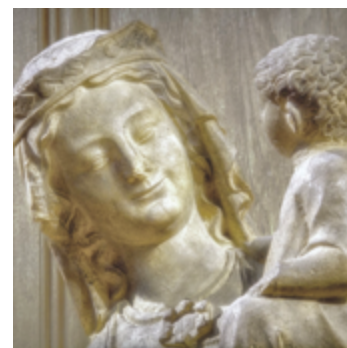
La Vierge au pied d'argent ou Notre-Dame du treillis, 13 e s. (copie), Saint-Jacques de Compiègne (original conservé au Musée A. Vivenel)