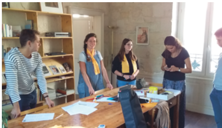
Rencontre au prieuré d'Attichy

Des jeunes choisissent de donner du temps, entre un mois et un an, au service de l'annonce de l'Évangile, dans les paroisses rurales du diocèse de Beauvais.