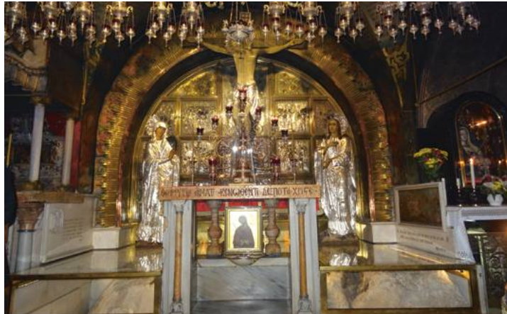
"Golgotha" : aujourd'hui chapelle orthodoxe au sommet du Golgotha. On aperçoit le sommet du rocher sous les vitres au bas de la photo.

« À Jérusalem tout est différent », me disait autrefois une sœur dominicaine. Je comprends peu à peu le pourtour de cette réalité. Pâques, le sommet de notre foi, est vécu ici selon les rites des 13 Églises chrétiennes qui regroupent les Chrétiens de Terre Sainte (1,5% de la population). Les Orthodoxes célébreront